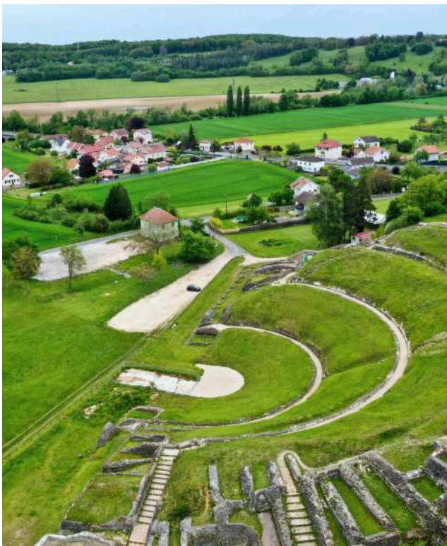
Théâtre antique de Mandeure

*petit instrument à deux ou trois dents, ancêtre probable de notre fourchette