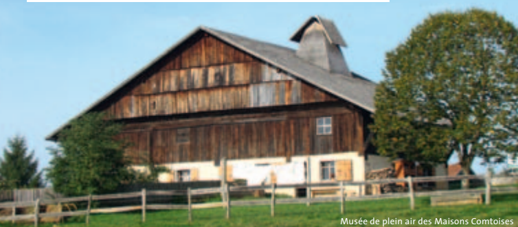
Musée de plein air des Maisons Comtoises

Dès le XVI e siècle, l'ingéniosité des anciens donne naissance à la célèbre ferme à tuyé. Une immense demeure en harmonie avec la nature, capable de recueillir les eaux de pluie, d'affronter l'hiver, et surtout de nourrir avec bonheur toute la famille, grâce à son centre de vie : le tuyé. C'est le foyer, l'âme, la cuisine et le garde-manger. Il laisse fumer lentement en son cœur les salaisons, dont la fameuse saucisse de Morteau.